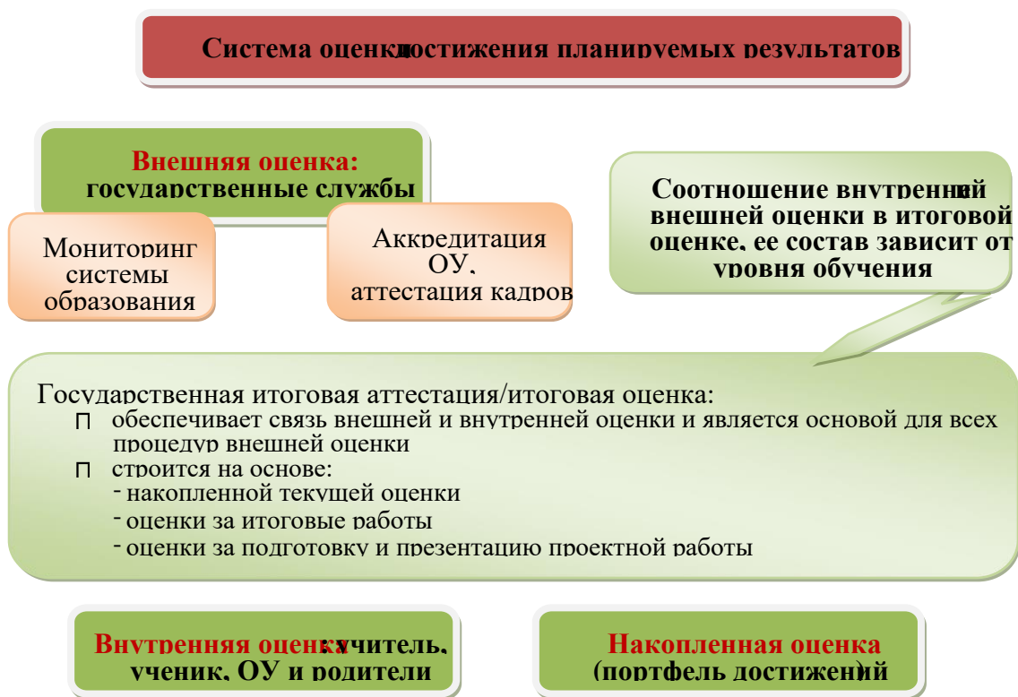
Рис. 2. Система оценки достижения планируемых результатов

Система оценки достижения планируемых результатов освоения основной образовательной программы основного общего образования предполагает комплексный подход к оценке результатов образования, позволяющий вести оценку достижения обучающимися всех трех групп результатов образования: личностных, метапредметных и предметных. В соответствии с Требованиями Стандарта предоставление и использование персонализированной информации возможно только в рамках процедур итоговой оценки обучающихся. Во всех иных процедурах допустимо предоставление и использование исключительно неперсонализированной (анонимной) информации о достигаемых обучающимися образовательных результатах. Интерпретация результатов оценки ведется на основе контекстной информации об условиях и особенностях деятельности субъектов образовательного процесса. Текущий контроль успеваемости обучающихся проводится в течение учебного периода (четверти, полугодия) с целью систематического контроля уровня освоения учащимися тем, разделов, глав учебных программ за оцениваемый период, прочности формируемых предметных знаний и умений, степени развития деятельностно-коммуникативных умений, ценностных ориентаций.